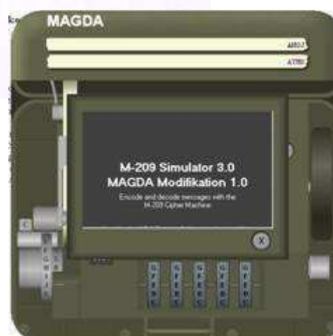
SW simulátor Hagelinu M-209, verze MAGDA od D. Rijmenantse.